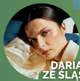
DARIA ZE ŚLĄSKA