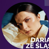
DARIA ZE ŚLĄSKA